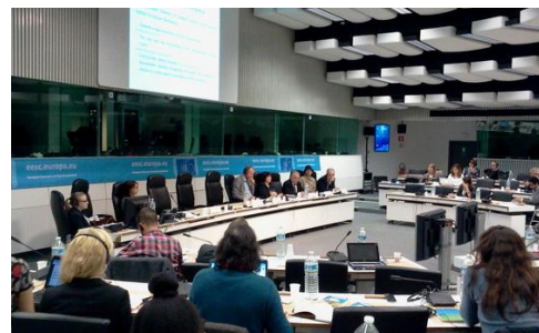
END ECOCIDE / COMMISSION EUROPÉENNE BRUXELLES