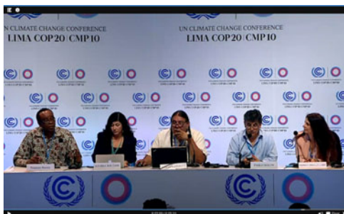
GLOBAL ALLIANCE / CONFERENCE DE PRESSE / LIMA COP20

ATTAC : Jacqueline Balvet < jbalvet@attac.org >