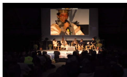
NATURERIGHTS / CONFERENCE AVEC BENKI PIYAKO, J. BOVÉ, P. RABHI - LYON